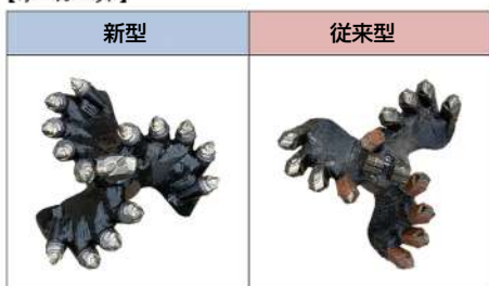
オーガヘッドは4種 φ330 2条 / φ450 2条 / φ450 3条 / φ540 3条